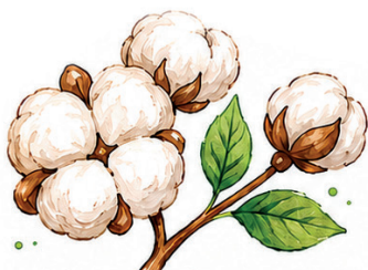
Material Orgânico Cultivo

Moda sustentável é pensar o vestir além da aparência. É buscar equilíbrio entre criação, ética e meio ambiente, considerando o ciclo completo da roupa: da fibra ao descarte. Mais do que uma tendência, é um compromisso com o futuro e com as pessoas envolvidas em cada etapa da produção.