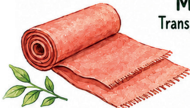
Tecido Reciclado de Materiais, como o Plástico