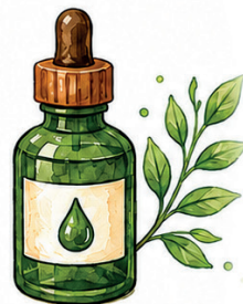
Corantes Naturais de Plantas