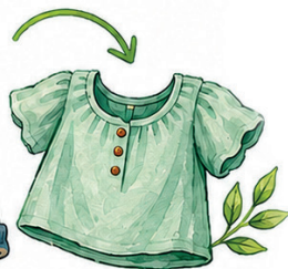
Upcycling Transforme Roupas Antigas em Novas.