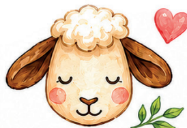
Respeito aos Animais