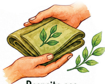
Respeito aos Direitos dos Trabalhadores