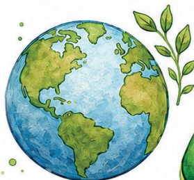
Ecológico Materiais Amigáveis ao Meio Ambiente